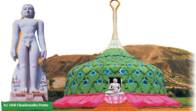
Sri 1008 Chandranatha Swamy